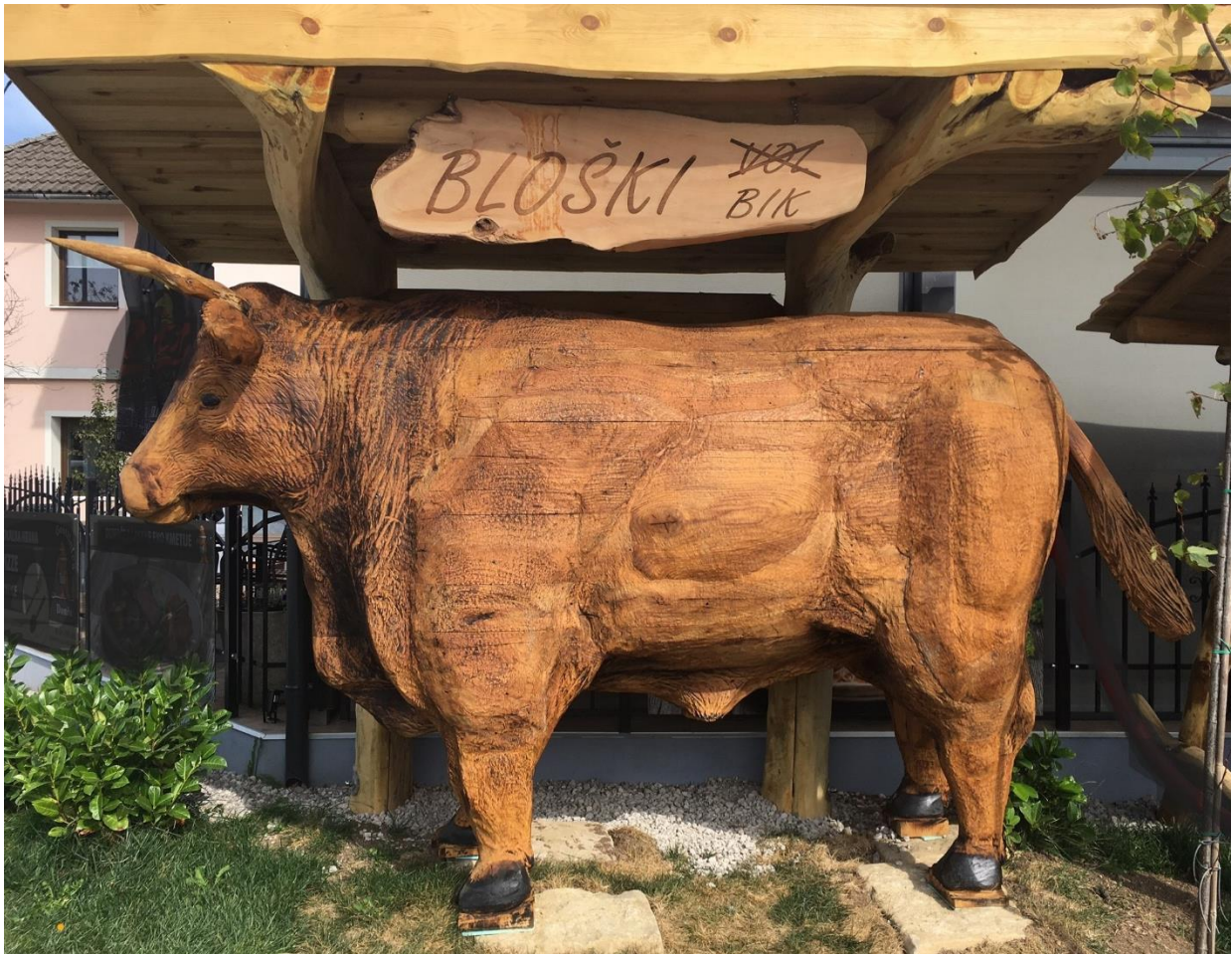
Slika 1: Bloški bik, Janez Hiti