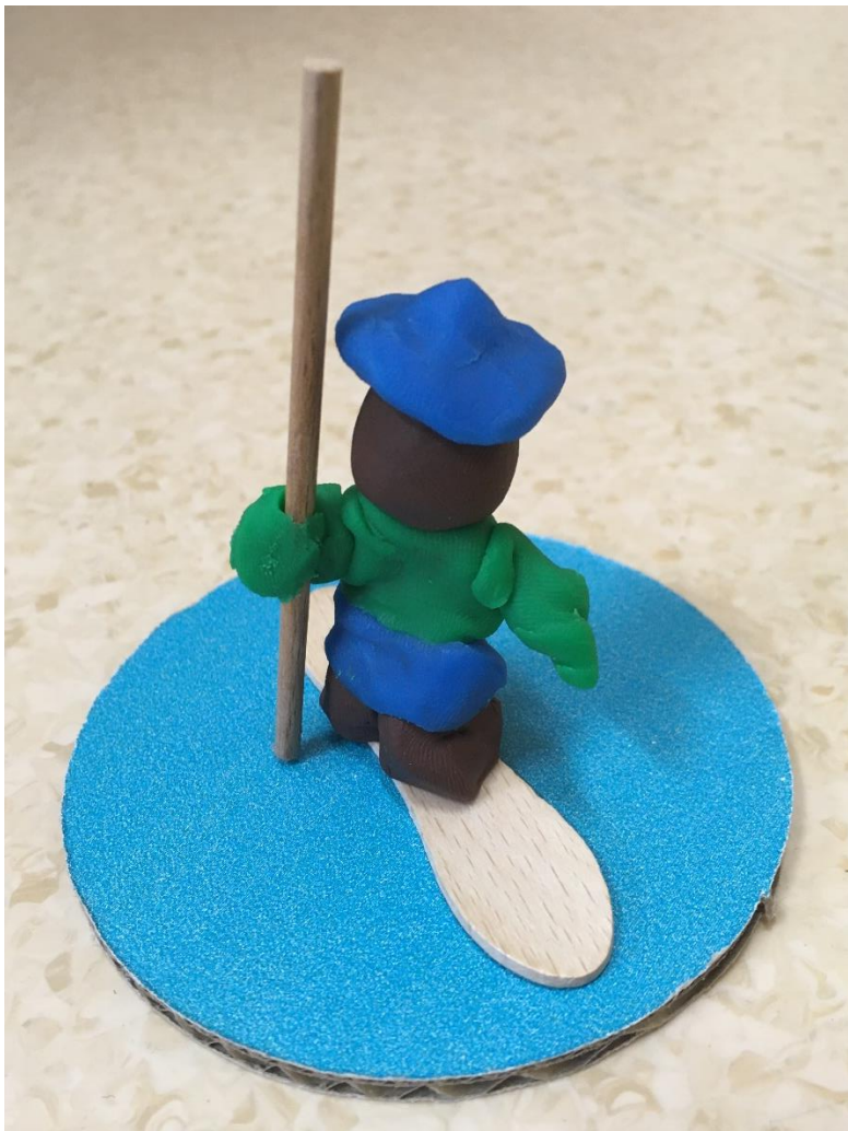
Slika 5: Bloški smučar

Danes ne smučamo več kot nekoč, a tu in tam se na bregu za šolo še spremenimo v prave bloške smučarje in se po strmini spustimo s starimi bloškimi smučkami ter tako vsaj malo spoznamo, kako so nekoč živeli naši predniki. Se pa v zimskem času med športno vzgojo radi podamo na tek na smučeh, če nam je le zima naklonjena s svojo belo snežno odejo.