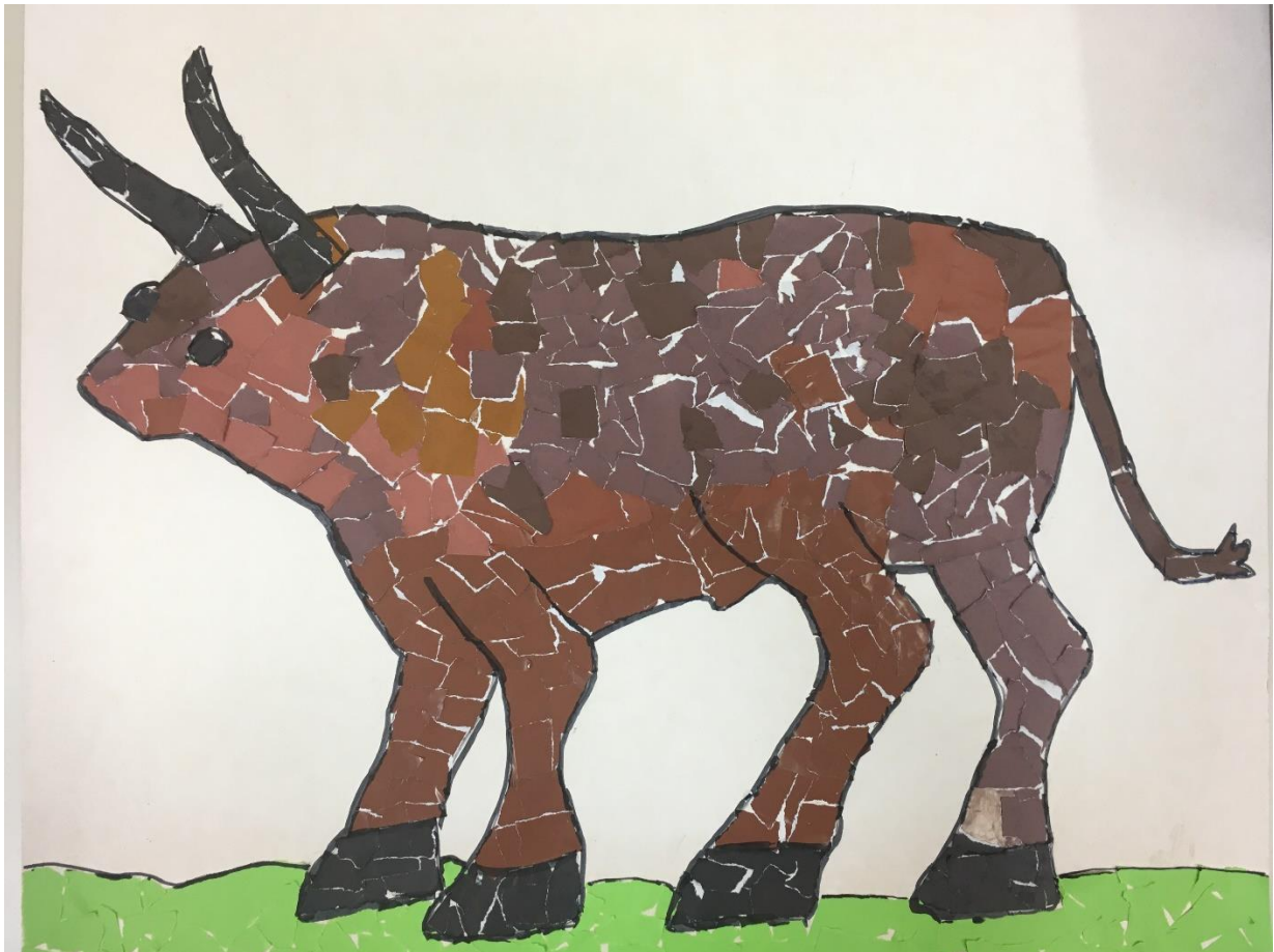
Slika 4: Bloški vol

Bločani so v preteklosti veljali za najboljše rejce in prekupčevalce z govedom. Njihov sloves o dobrih bloških volih je segal daleč v "deveto vas". Na sejmih širom Slovenije in Hrvaške so kupovali "skumrane" – suhe in sestradane vole in jih preko leta z dobro bloško krmo vzredili v močne živali za delo napolju in v gozdu. Take so v jeseni na Mihaelovem sejmu prodali za dobre denarce. Tako kot Bločani so bili odločni, močni in trmasti tudi njihovi voli. Volov danes na Blokah ni več, je pa ostal rek – Trmast kot bloški vol.