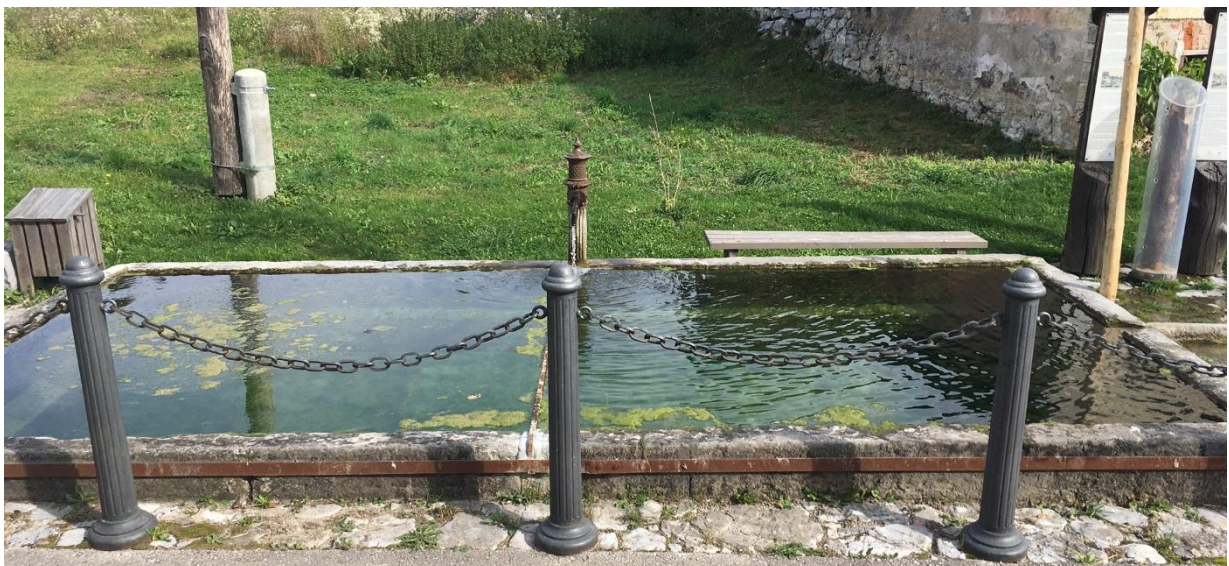
Slika 2: Zgornja štirna